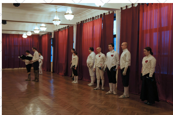
Ассамблея Grand Assaut/ Гранд Ассо 2015

Ассамблея Grand Assaut/ Гранд Ассо. Ассо - вольные поединки фехтовальщиков, в сочетании с красотой старинных танцев — дань петербургским традициям XVIII века. Турнир Гранд Ассо является главной проверкой мастерства фехтовальщиков классического направления.