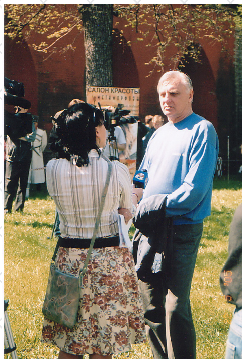
I День Фехтовальщика. 2005