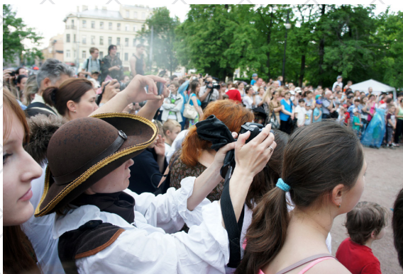
День Фехтовальщика 2014