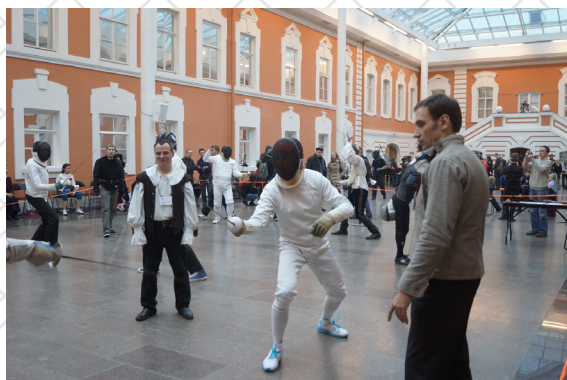
Grand Assaut/ Гранд Ассо Петропавловская Крепость 2012