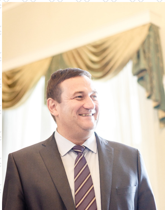
Константин Эдуардович Сухенко – председатель комитета по культуре Правительства Санкт-Петербурга

191186, Санкт-Петербург, Невский проспект, д. 40. Тел. (812) 312-2471 факс (812) 710-5515, E-mail: kklult@gov.spb.ru