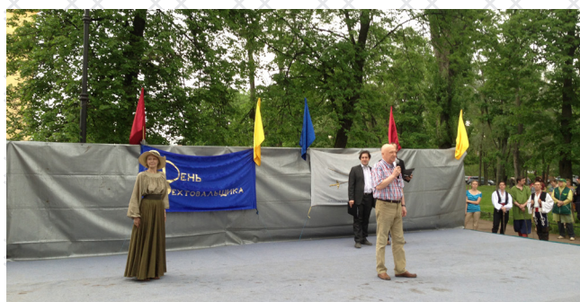
Открытие X праздника День Фехтовальщика, 2014

«Родители и дети, подростки и взрослые могут познавать красоту мира через фехтование. Надо постараться совместить спортивное фехтование с историческим и просто с «культурным досугом». Итак, спортсмены прошлых лет, артисты (объяснять не надо), все желающие любого возраста ради удовольствия, поклонники исторического фехтования и, не смейтесь, французского языка и культуры, фанаты рапиры, шпаги и сабли как таковых – вот реальный и потенциальный контингент нового клуба».