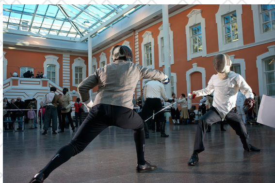
Grand Assaut/ Гранд Ассо Петропавловская Крепость 2011

GRAND ASSAUT ГРАНД АССО САНКТ-ПЕТЕРБУРГСКИЙ ФЕХТОВАЛЬНЫЙ КЛУБ