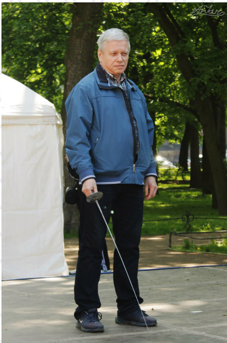
Открытии XII праздника День Фехтовальщика. 2016