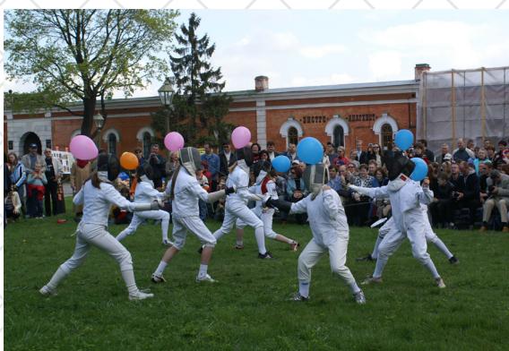
«Султанчики» - соревнования юных спортсменов из клуба «Старт» Петроградского района, 2005