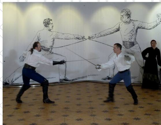
Вернисаж выставки "Со знанием дела". 2014