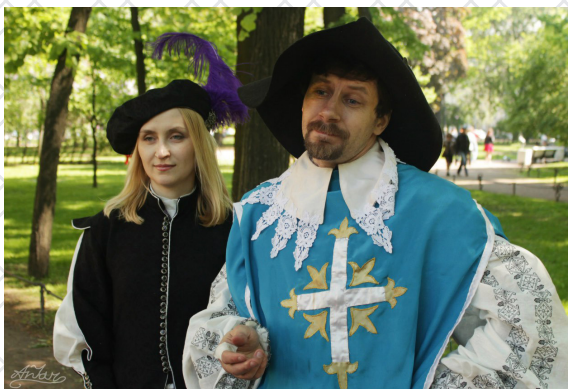
День Фехтовальщика 2016