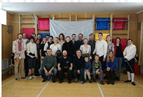
Святочный вечер фехтовальщиков - 2015

Газета для пассажира «СТРЕЛА» № 25 (816) от 20 июня 2012