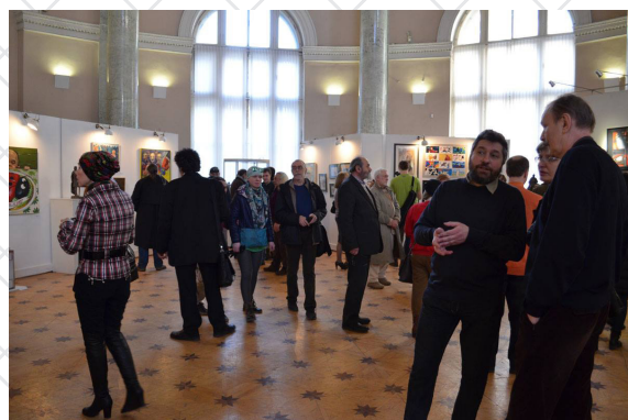
IV Биеннале "Фехтование в искусстве" 2015

Телевидение. НТВ. Новости культуры 07 апреля 2009