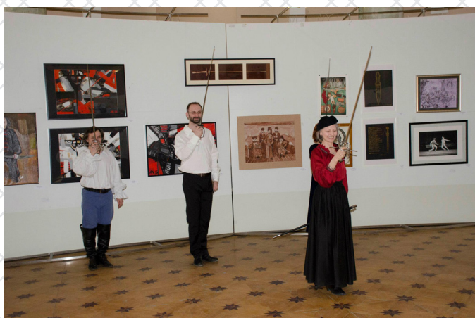
Салют в честь 10-летия СПбФК на вернисаже IV Биеннале "Фехтование в искусстве". 2015

«Санкт-Петербургский фехтовальный клуб, претендует на лидерство не только громким названием, но и просветительской деятельностью: уже несколько лет массово отмечает День фехтовальщика, устраивает поединки на пленэре и помимо мастеров спорта и актеров активно привлекает художников».